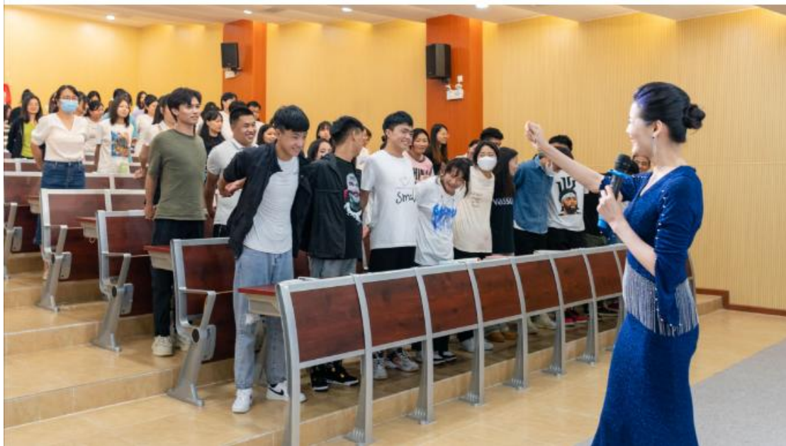
图 4 为校中企直播达人现现场教学

通过产教融合、校企合作，提升高技术技能人才的一体化培养质量，服务粤港澳大湾区建设和本地产业经济的发展。探索多元教学模式，立足校外企业、校中企和专业实际，以市场需求为导向，校企业协同培养直播电商人才，服务地区经济发展。