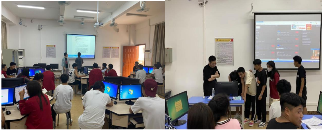
图 3 为校中企企业导师现场授课