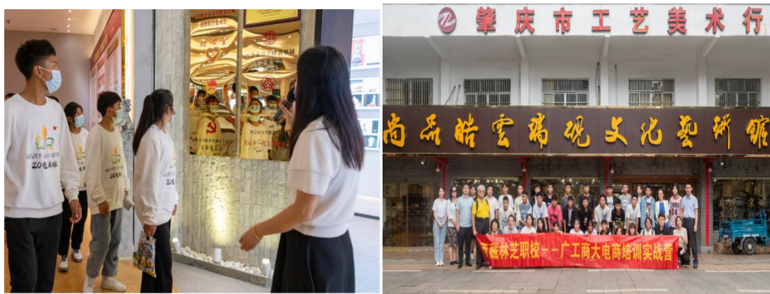
图 2 为四会玉器电商直播基地、端砚文化艺术馆等参观访学