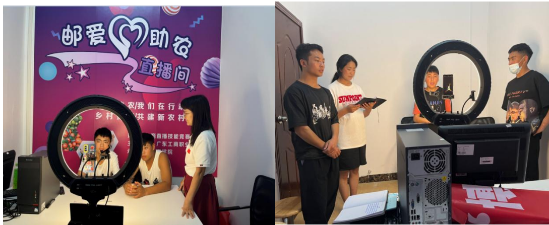
图 1 为直播电商实践教学

采取强化课内实践，深度与企业融合的方式开展教学。强化企业实践环节，由专业班主任带领学生深入企业电商运营、电商直播、电商物流一线岗位进行见习。